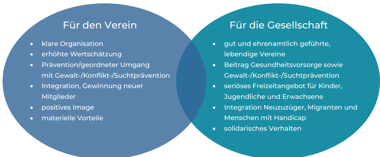
Abb. 1 Nutzen von Sport-verein-t